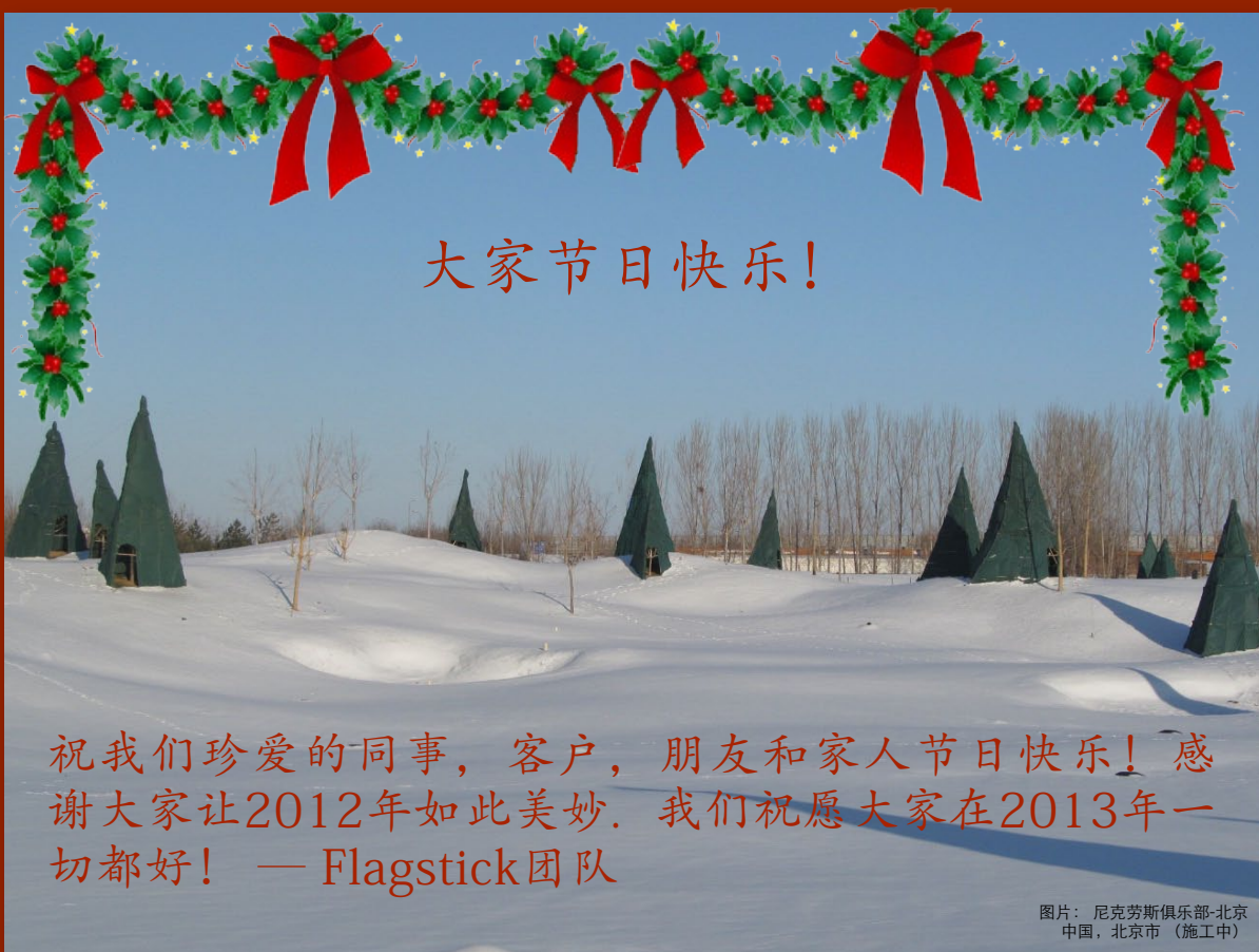
图片：尼克劳斯俱乐部-北京 中国，北京市（施工中）